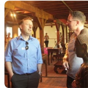
Ethnologische Privatsammlung Ein besonderer Blick auf Afrika, Papua-Neuguinea und Burma.