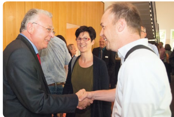
Herzlich Willkommen Das NTX-Team begrüßte die Teilnehmer im Binshof.