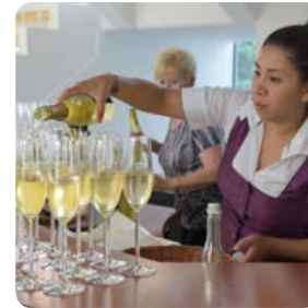
Aromatische Erfrischung Eine reizvolle Kombination: Sekt mit Sancho-Pfeffer